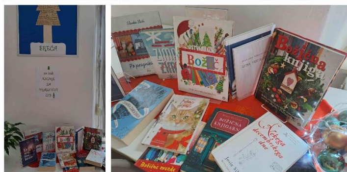
Čarobni božični trenutki v oddelku Lava.