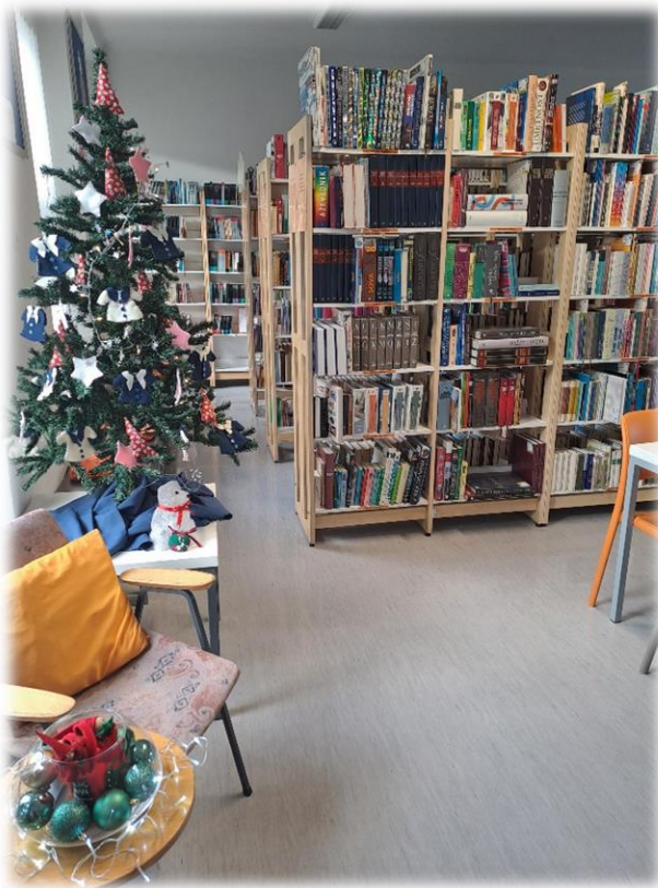
Smrečica v oddelku Glazija.

V obeh oddelkih smo knjižnico praznično okrasili ter jo tako pripravili za iskanje čarobnega zimskega branja.