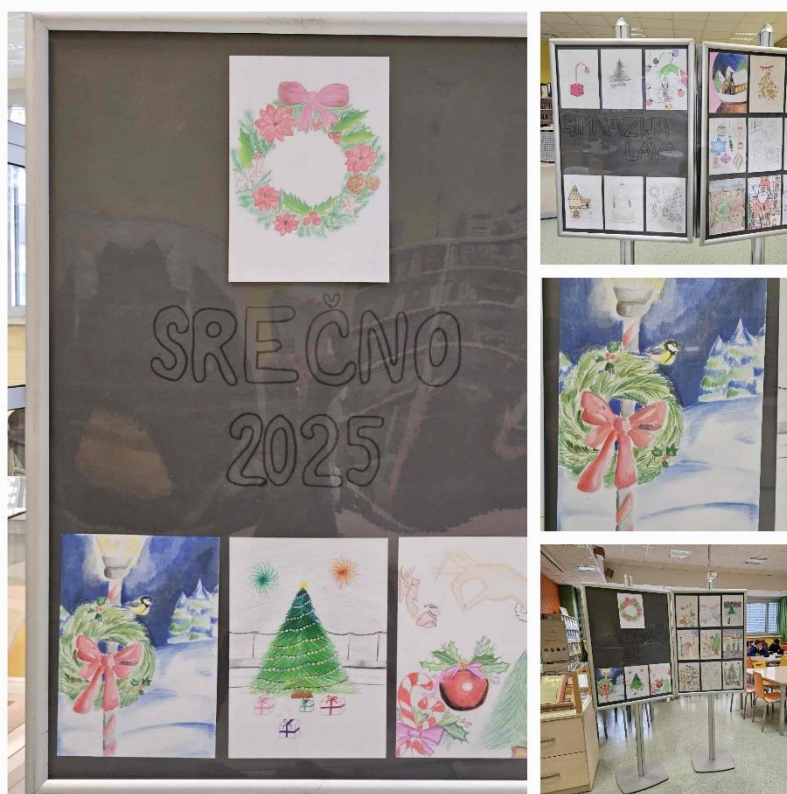
Gimnazijci so ustvarjali praznične motive.

Razstava njihovih del je na ogled v šolski knjižnici v oddelku Lava.