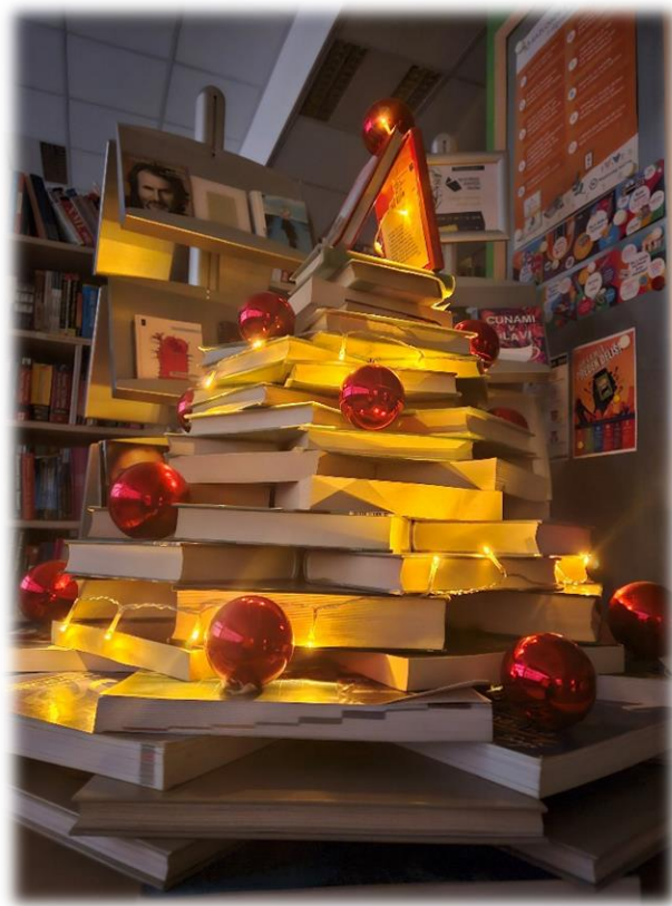
Smrečica v knjižnici Lava.