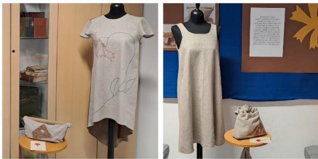
Spominek naših korenin.