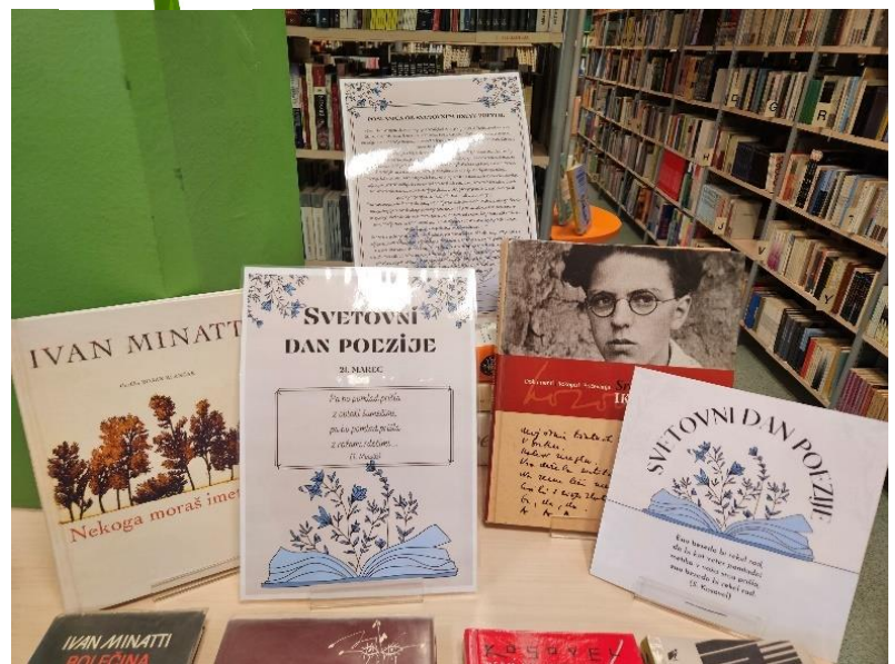
Razstava ob svetovnem dnevu poezije.

Vabljeni v knjižnico na druženje z njuno poezijo.