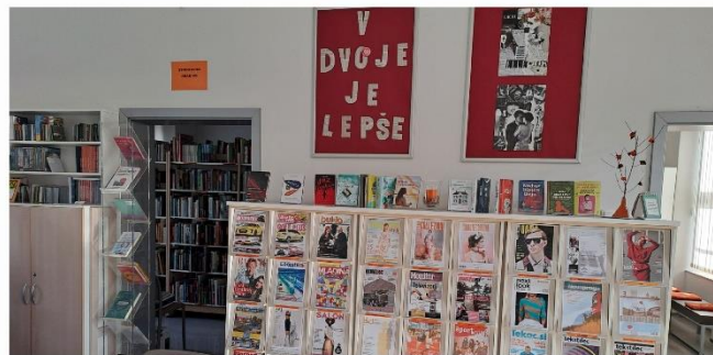
V dvoje je lepše.