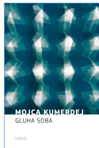
Kratke zgodbe »o odnosih«.

Po prebrani Gluhi sobi tesnobno ugotavljamo, da ostaja vprašanje, kaj čaka razčlovečeni svet v prihodnosti, odprto.