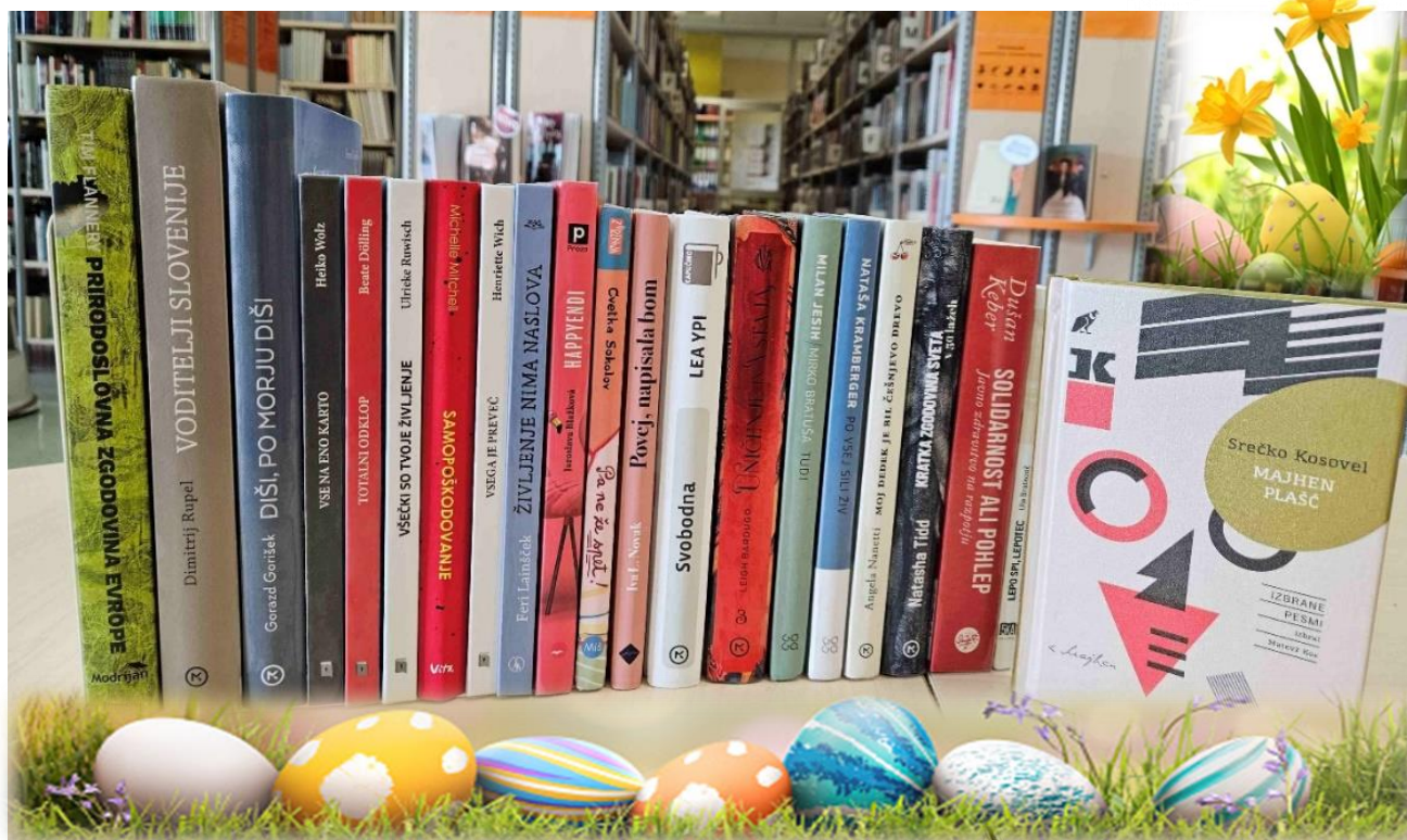
Knjižne novosti meseca marca.

E-pošta: knj@sc-celje.si , knj.glazija@sc-celje.si