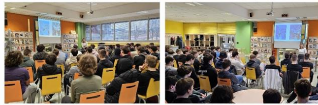
Dan odprtih vrat na SŠ KER v šolski knjižnici.