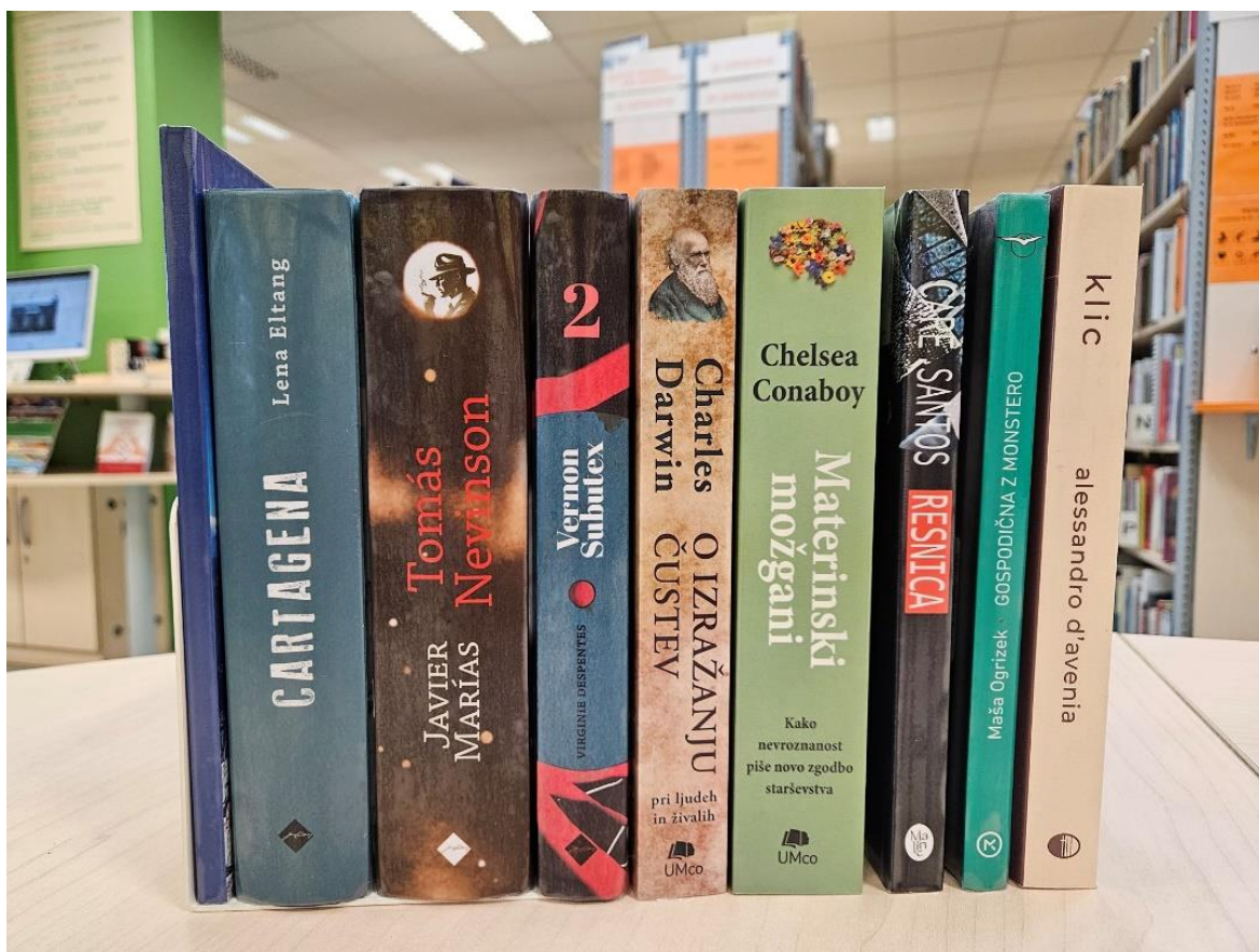
Knjižne novosti meseca februarja.