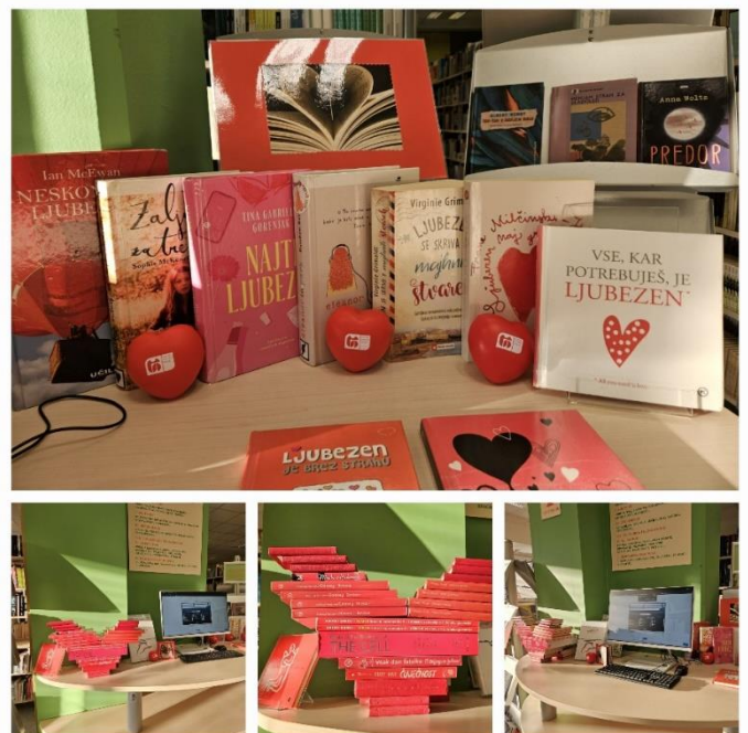
Ljubezen med knjižnimi platnicami.