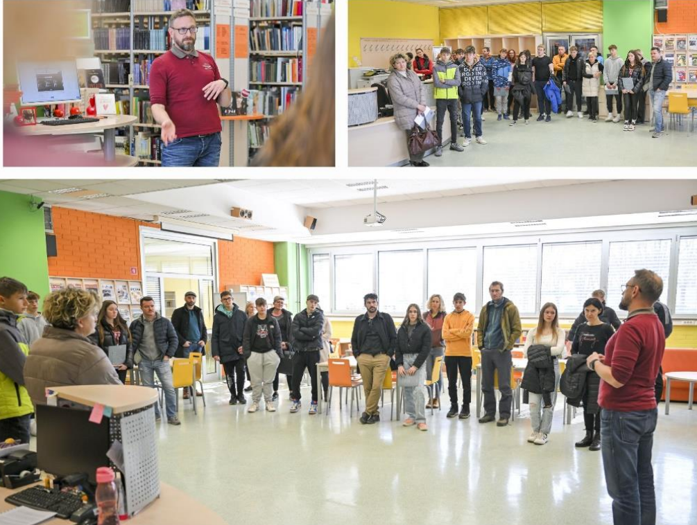
Predstavitve knjižnice na letošnjih informativnih dnevih.

V petek, 16. 2. 2024, in v soboto, 17. 2. 2024, smo na informativnem dnevu na Šolskem centru Celje gostili bodoče dijake. Seznanili so se z različnimi izobraževalnimi programi in s prostori na šoli. Ustavili so se tudi v šolski knjižnici, kjer smo vsem obiskovalcem predstavili bogat knjižnični fond, izposojajo knjižničnega gradiva, učbeniški sklad in urnik knjižnice ter na koncu odgovorili na vsa vprašanja. Bodočim dijakom smo knjižnico Šolskega centra Celje predstavili kot prostor za učenje, raziskovanje in sprostitev.