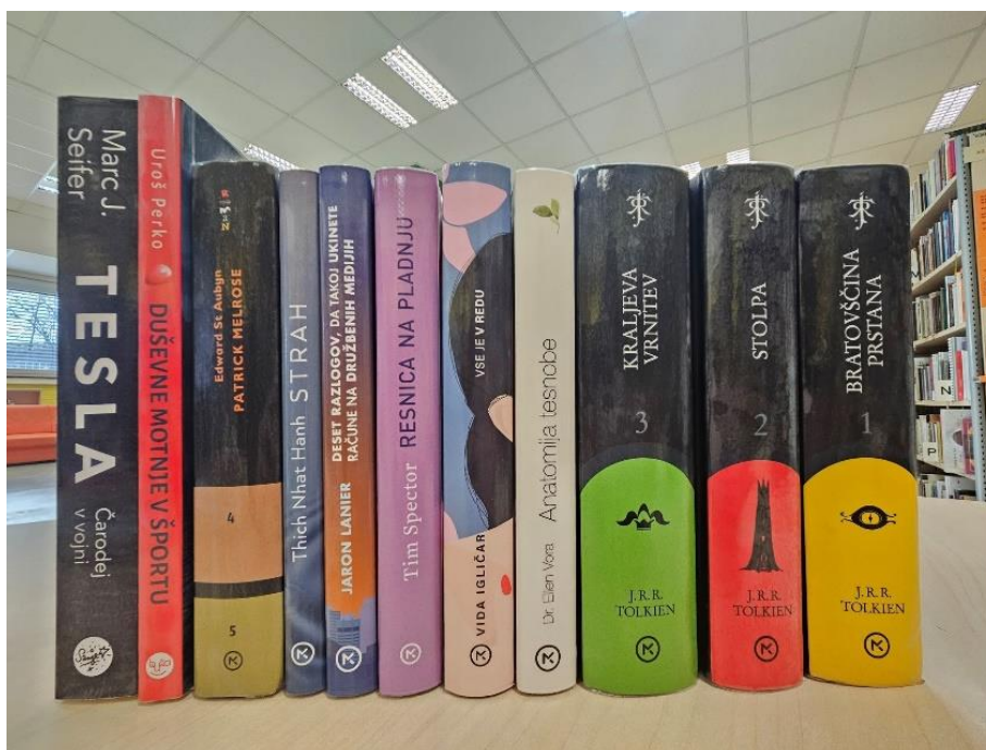
Knjižne novosti meseca januarja.