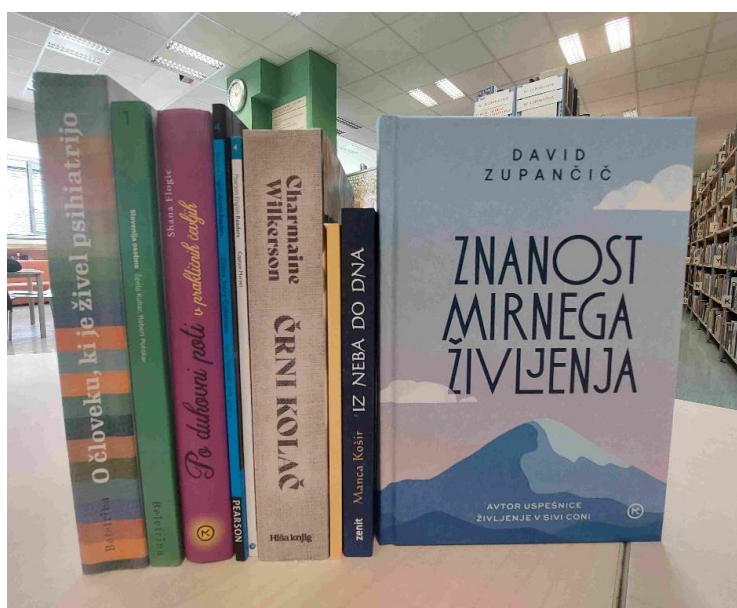
Knjižne novosti meseca novembra.