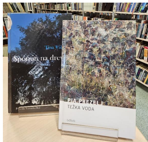
Zlata hruška 2023 in najboljši literarni prvenec.