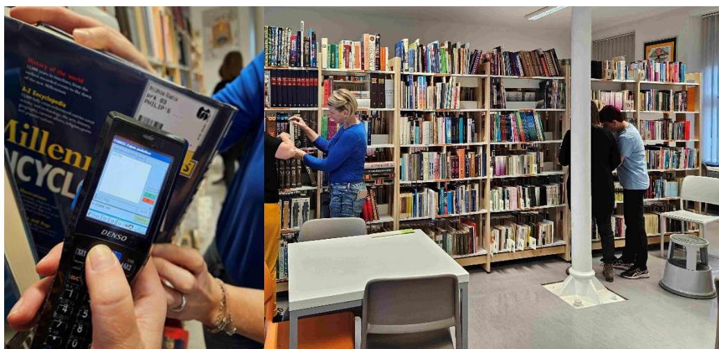
Člani komisije za popis knjižničnega gradiva so se trudili, da bo knjižnica čimprej odprta.

November smo v obeh oddelkih knjižnice posvetili pripravam na inventuro in njeni izvedbi.