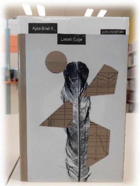
Leteči ljudje Ajde Bračič.

Vas mika brati kaj čisto novega? → Naslovi so zbrani v priponki Knjižne novosti meseca septembra.