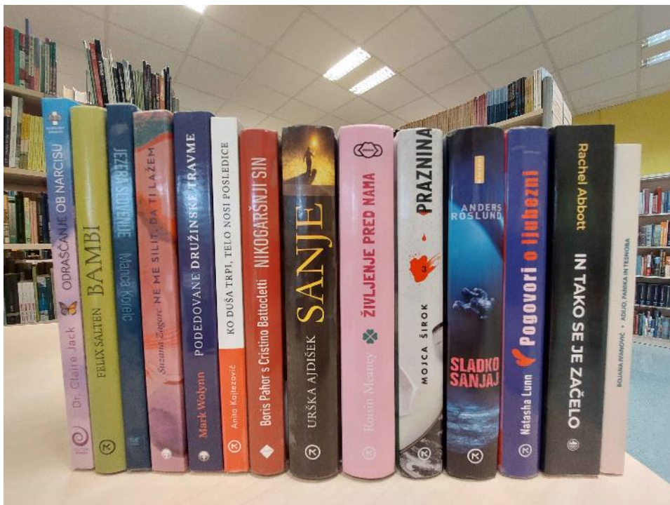
Knjižne novosti meseca septembra.

E-pošta: knj@sc-celje.si , knj.glazija@sc-celje.si