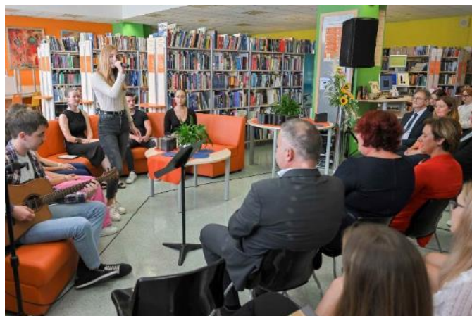
Sprejem najbolj uspešnih dijakov ŠC Celje, generacije 2022/2023.