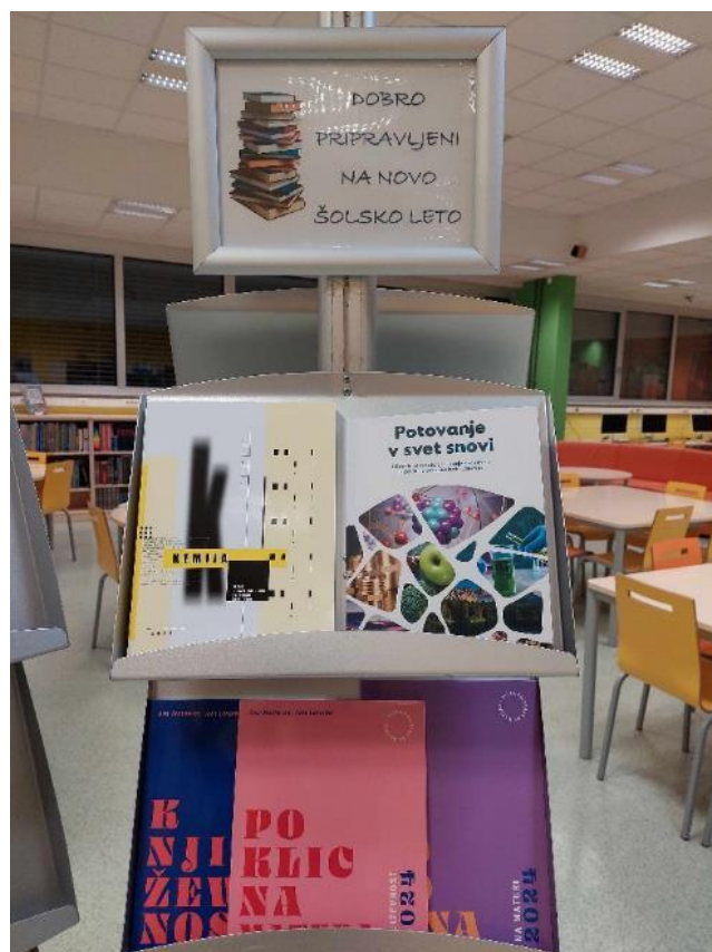
Dobro pripravljeni na novo šolsko leto.