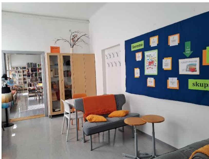
Uradni plakat vseslovenske akcije Beremo skupaj in misli o branju v knjižnici Glazija.

Vse dogodke, ki bodo še potekali v okviru NMSB 2023 , najdete v njihovem dogodkovniku .